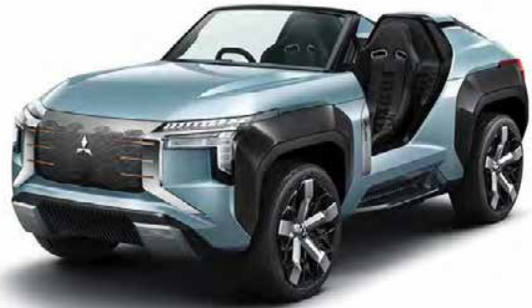
شهد جناح ميتسوبيشي موتورز إزاحة الستار عن السيارات الجديدة لعام 2020 من ضمنها «ميتسوبيشي إنجلبرج تور» MITSUBISHI ENGELBERG TOURER وهي مركبة متعددة الاستخدامات من الحجم المتوسط وتعمل بالطاقة الكهربائية

الكهربائية، ومركبة الكروسوفر إكليبرس كروس، ومركبة ASX، وكذلك الفان الصغير دليكا D:5 وغيرها من الطرازات. وكان الإعلاميون من قطر من أوائل الذين يعاينون مركبة الكروسوفر ASX الجديدة من طراز 2020، وذلك خلال تدهينها في المعرض. وشهدت ASX العديد من التغييرات في التصميم الخارجي حيث تتبنى من الامام أسلوب «ميتسو الدرع الحيوي» مع مصابيح أمامية بتقنية LED ومصابيح خلفية عريضة. كما اعتمدت ميتسوبيشي غطاء سفلياً للمركبة باللون الفضي يمنح المظهر العام إنفاقة إضافية، إلى جانب تغيير الصدام الخلفي ليكتمل التصميم العام برشاقة وحيوية. تعمل ASX 2020 بمحرك بسعة 2 لتر يوفر القوة اللازمة للمركبة في جميع الظروف. وتتيح تقنية MIVEC المعتمدة في المحرك توليد قوة قصوى من دون استهلاك المزيد من الوقود مع المحافظة على المعايير البيئية. من الداخل، زودت ASX بشاشة عرض بحجم 8 إنش ما يجعل نظام الملاحة والتصفح والرؤية من الكاميرا الخلفية سهلاً ومريحاً. وفيما يتعلق بمعايير السلامة، تضم المركبة العديد من المزايا منها نظام التحذير من النقطة العمياء، نظام المساعدة في تغيير المسارات، نظام